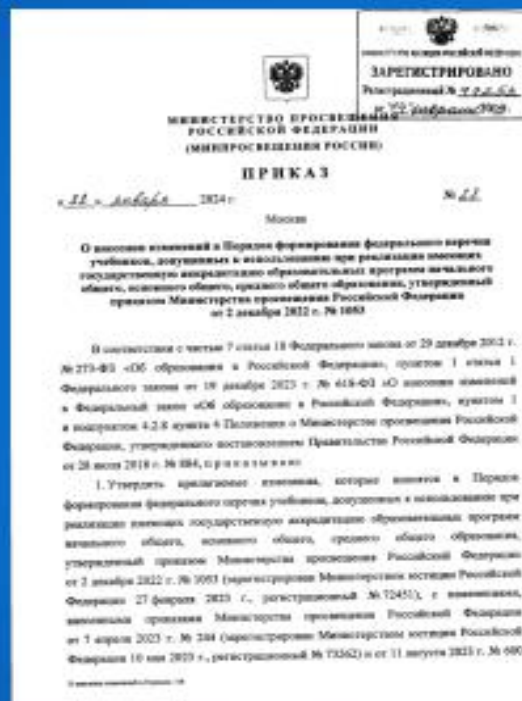
Приказ Министерства просвещения Российской Федерации от 22.01.2024 № 28 «О внесении изменений в Порядок формирования федерального перечня учебников...»