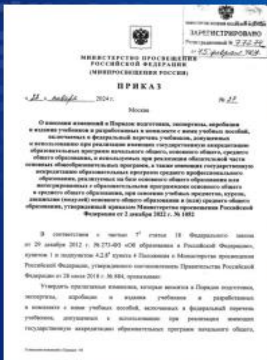
Приказ Министерства просвещения Российской Федерации от 22.01.2024 № 27 «О внесении изменений в Порядок подготовки, экспертизы, апробации и издания учебников и разработанных в комплекте с ними учебных пособий, включаемых в федеральный перечень учебников...»